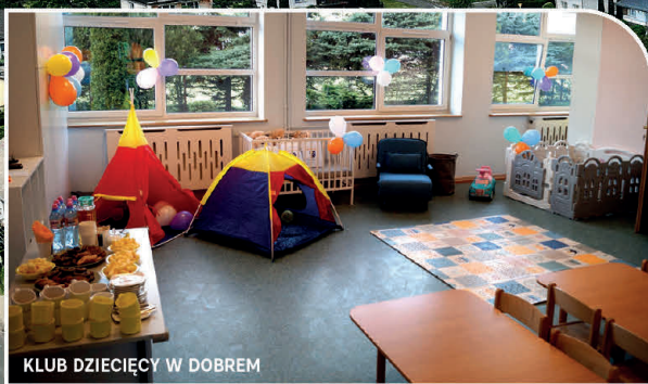
KLUB DZIECIĘCY W DOBREM