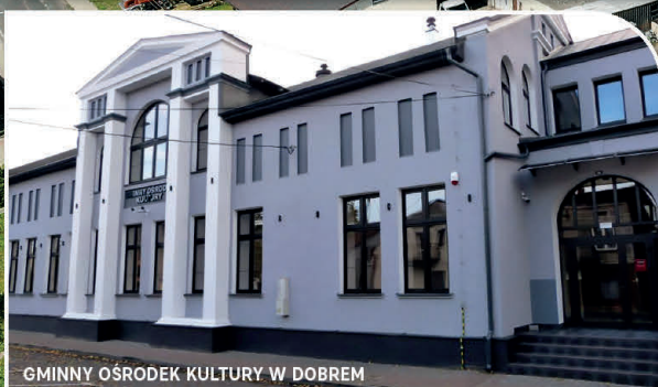
GMINNY OŚRODEK KULTURY W DOBREM