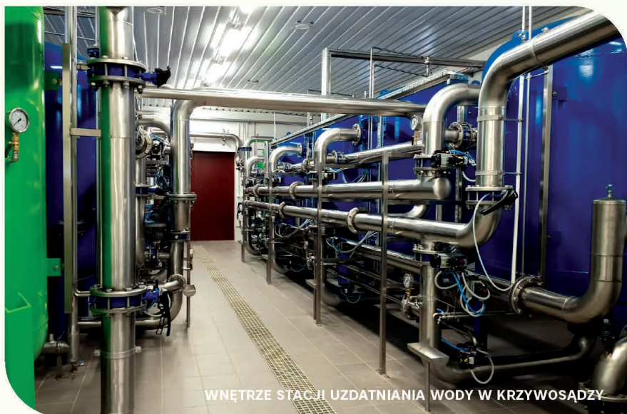
WNĘTRZE STACJI UZDATNIANIA WODY W KRZYWOSĄDZU

Gmina Dobrze jest zwodociągowana w 100%. Taki poziom należy do jednych z najwyższych w województwie. Mieszkańcy są zaopatrywani w wodę do picia pochodzącą z 4 gminnych ujęć. Z kanalizacji korzysta z kolei przeszło 50% mieszkańców. Gminę obsługuje mechaniczno-biologiczna oczyszczalnia ścieków o przepustowości 400 m 3 /d.