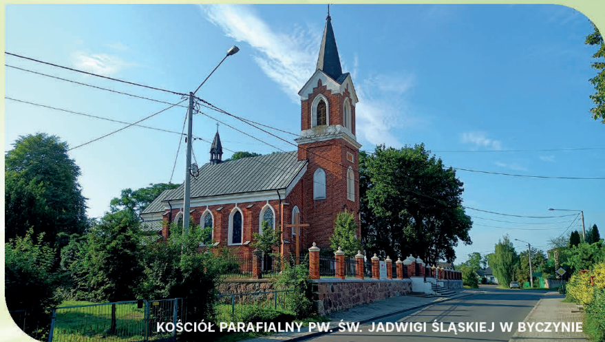
KOŚCIÓŁ PARAFIALNY PW. ŚW. JADWIGI ŚLĄSKIEJ W BYCZYNIE

fii pw. Wniebowzięcia Najświętszej Maryi Panny z 1863 r. w Krzywosądz, dwór z lat 1850-1860 wraz z ogrodem w Krzywosądz oraz wystrój malarzki sklepienia prezbiterium i nawy głównej z lat 1900-1903 w kościele w Byczynie.