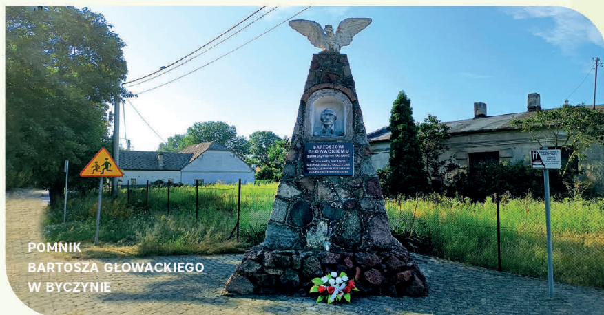
POMNIK BARTOSZA GŁOWACKIEGO W BYCZYNI