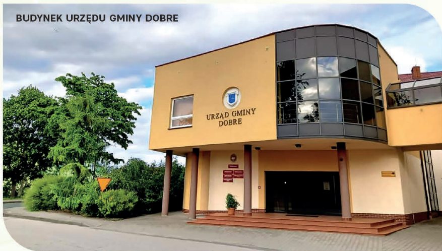
BUDYNEK URZĘDU GMINY DOBRE

W okresie zaborów ziemi te znajdowały się pod panowaniem Rosjan. W 1863 r. na Kujawach wybuchło Powstanie Styczniowe, które doprowadziło do dużych zniszczeń. Przez długi czas po zrywie narodowym Dobro było podupadłą, typowo rolniczą wsią, do której można było dotrzeć jedynie konno.