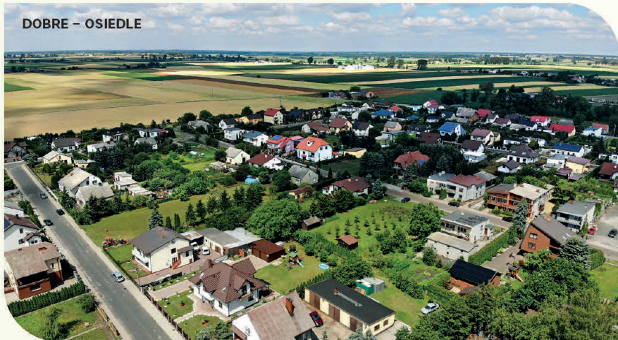
DOBRE – OSIEDLE