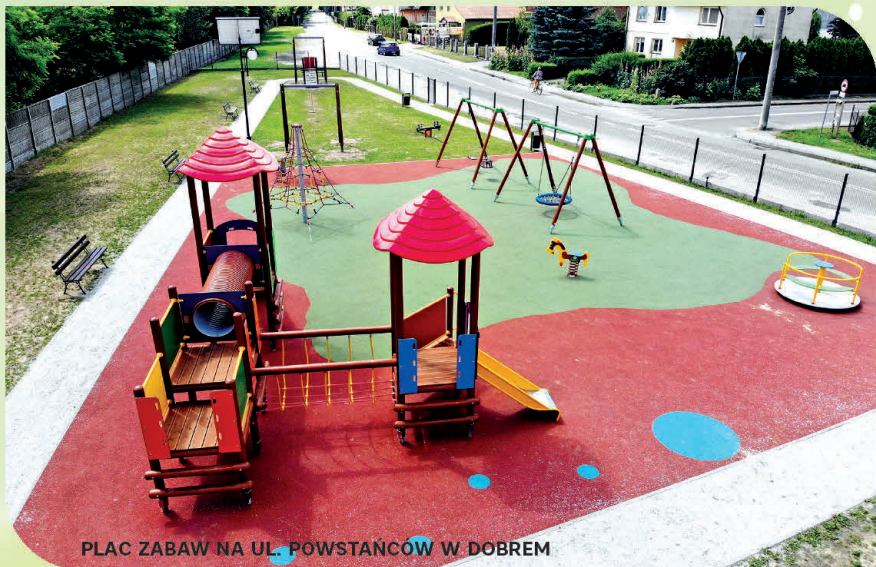
PLAC ZABAW NA UL. POWSTAŃCÓW W DOBREM