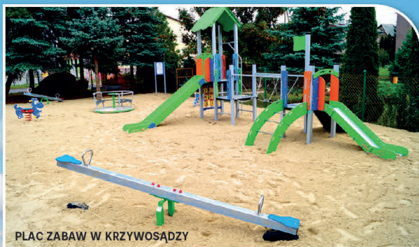
PLAC ZABAW W KRZYWOSADZY