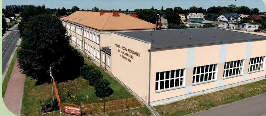
PUBLICZNA SZKOŁA PODSTAWOWA IM. JANUSZA KORCZAKA W KRZYWOSĄDZ

Przy szkołach funkcjonują nowoczesne sale sportowe, a każda z placówek wyposażona jest w wysokiej klasy sprzęt komputerowy. Dzieci i młodzież ze szkół na terenie gminy mogą pochwalić się osiągnięciami w konkursach przedmiotowych uzyskując dzięki zajmowanym w nich wysokim miejscom m.in. zwolnienia z egzaminów zewnętrznych. Wychowankowie placówek odnoszą również liczne sukcesy sportowe na szczeblu powiatowym i wojewódzkim w konkurencjach indywidualnych i dyscyplinach zespołowych.